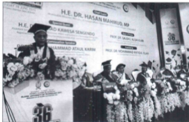
গাজীপুর: গতকাল আইইউটিএর সমাবেশে অনুষ্ঠানে বক্তব্য রাখেন পররাষ্ট্রমন্ত্রী হাসান মাহমুদ

SOURCE: The daily NEW NATION on 25/06/2024